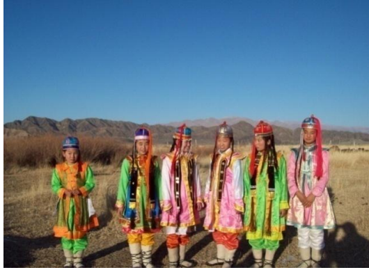
무형문화유산 보유자 어린이들