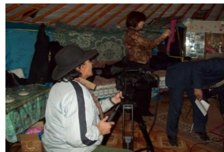
무형유산 보유자를 촬영 중인 기록팀