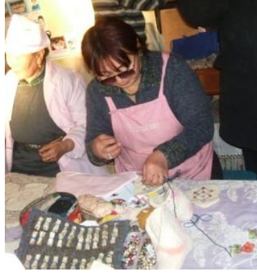
바가누르 마을의 노인들이 제작하는 공예품