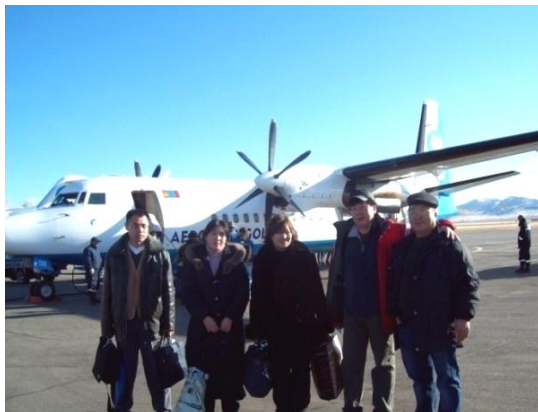
코브드 지역 답사팀