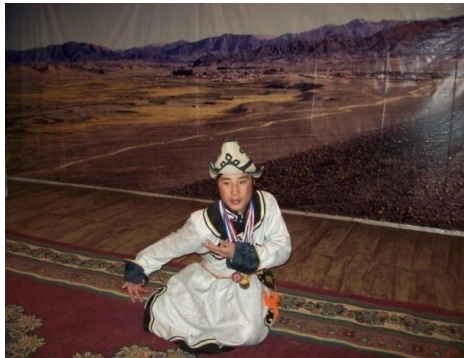
몸의 춤 Bii biyelgee