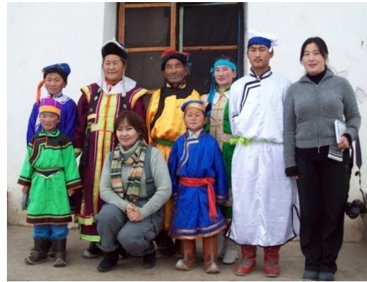
현장연구팀과 함께 한 보유자들