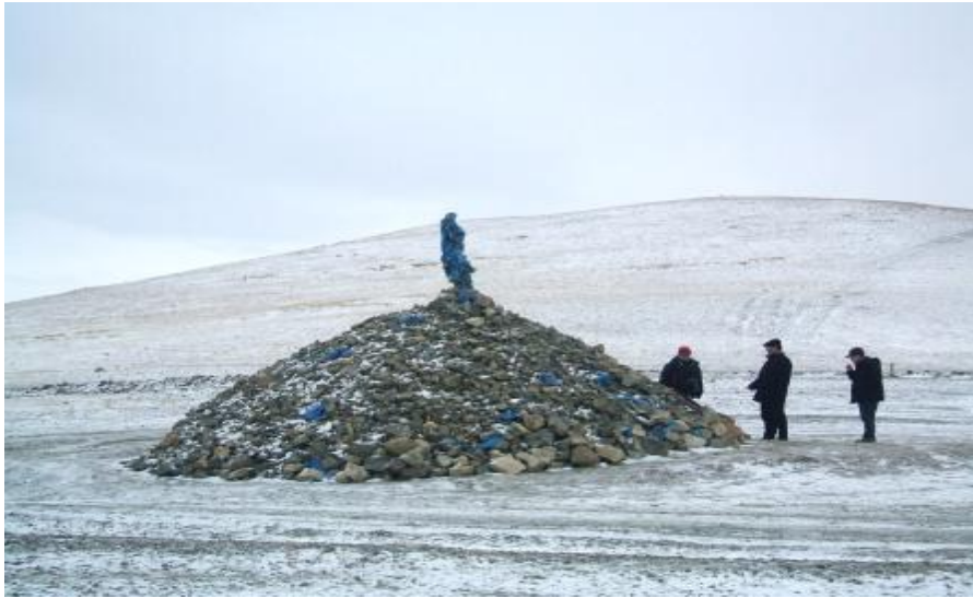
돌 산을 세 번 돌고 돌을 얹으며 기원하는 몽골 전통 풍습 오부(Ovoo) 체험