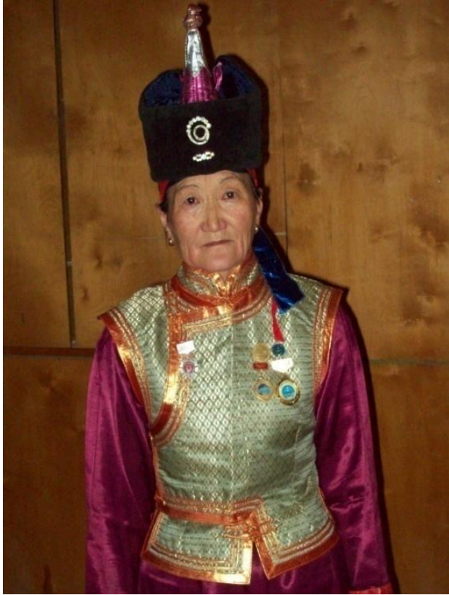
무형문화유산 보유자 연장자