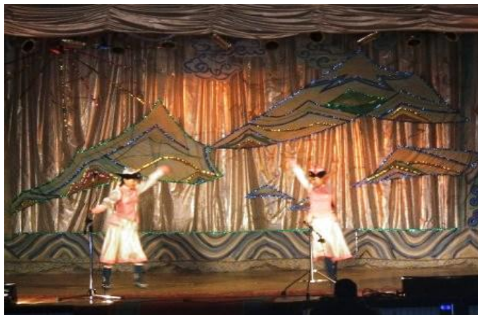
바가누르 Baganuur 마을의 무형유산