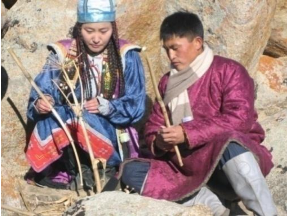
몽골 서부 지역의 특산식물로 만드는 악기 추르 Tsuur