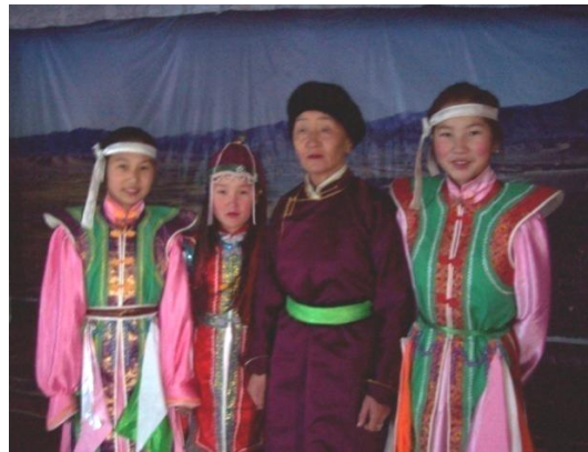
세대를 이어 전승되는 무형유산