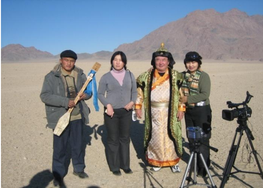
무형유산 보유자들은 기록 작업에 적극적으로 참여하였다.