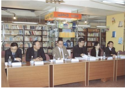
몽골 비정부 기구 대표들