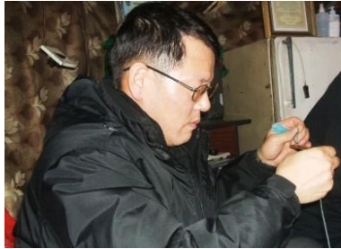
한국 대표단의 공예품 제작 체험