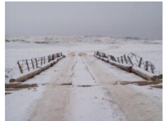
추운 바람과 험한 산길, 미끄러운 눈길