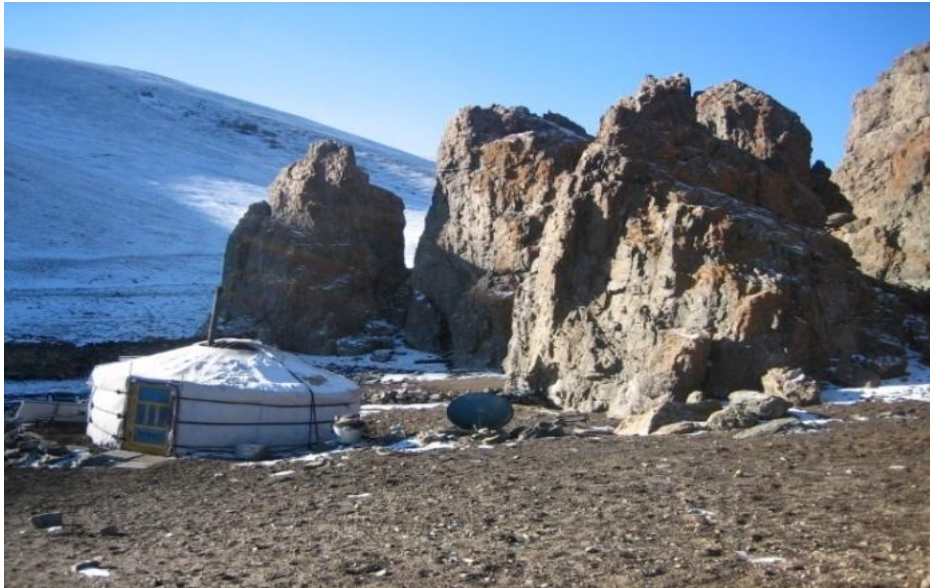
무형유산 보유자의 겨울 캠프