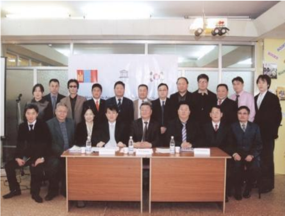
회의 참가자 단체사진