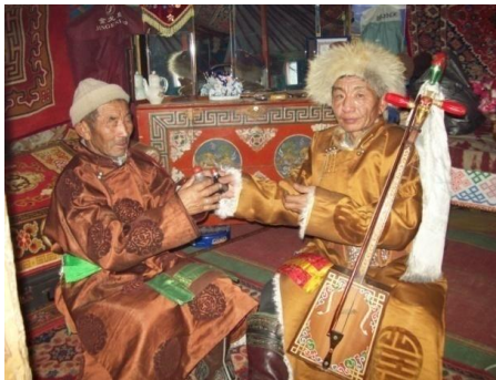
인사를 나누며 코담배 함을 교환하는 몽골의 풍습