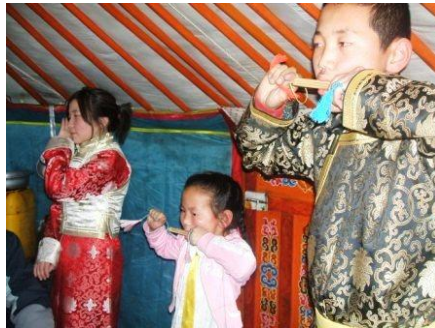
보유자 가정 방문