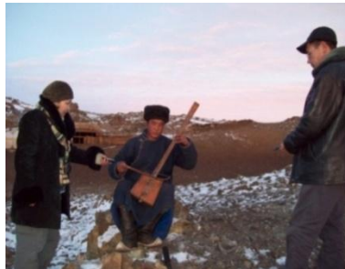
현장에서 기록 작업 중인 촬영팀