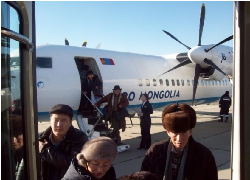
울란바토르로 돌아오는 현장 조사팀