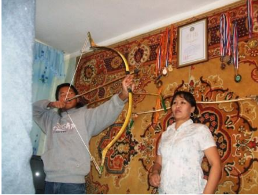
바가누르 마을의 무형유산 보유자가 재능과 기술을 시연하는 모습